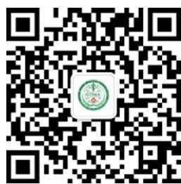
广东省医学会学术交流